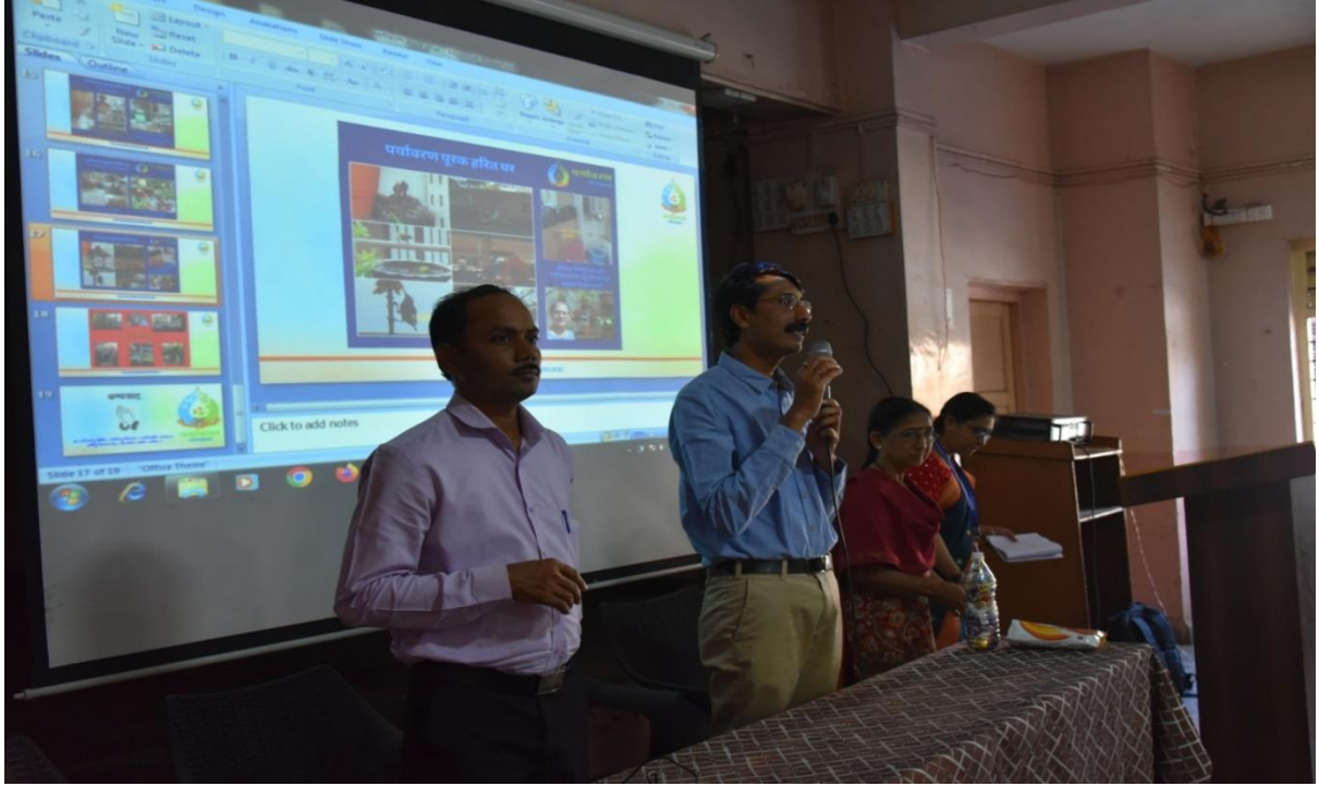
Conducting Demo for Recycling